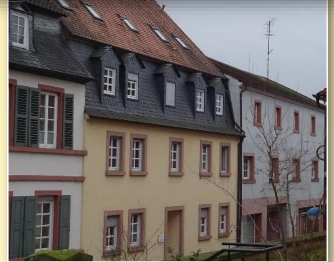
Nach der Sanierung

Welche Maßnahmen können gefördert werden?