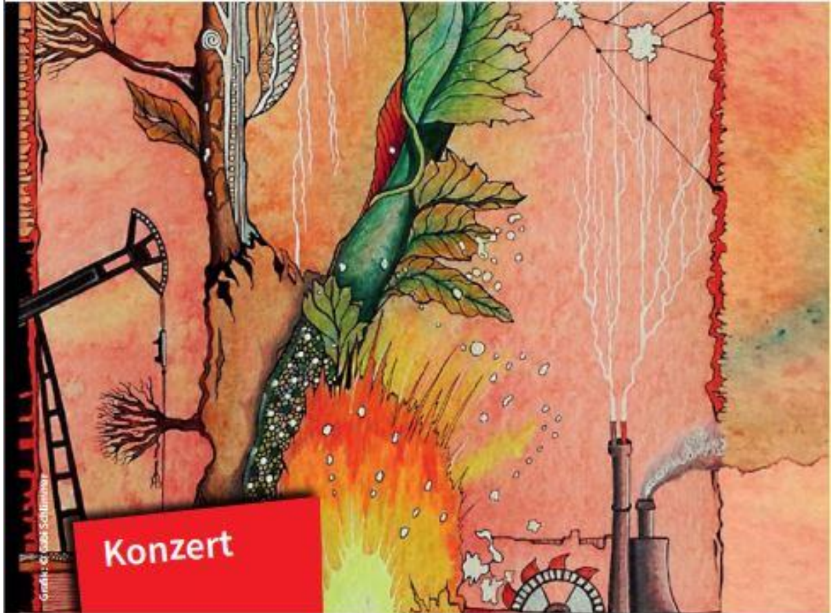
Grafik: Gabi Schlimmer