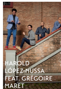
HAROLD LÓPEZ-NUSSA FEAT. GRÉGOIRE MARET